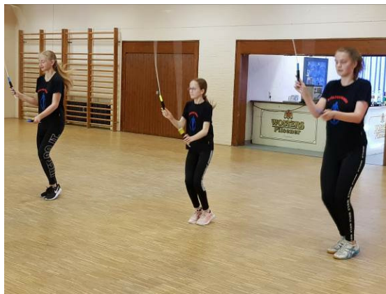
Die Aufführung der Mühlenspringer mit akrobatischen Einlagen mit dem Sprungseil war ein Highlight.