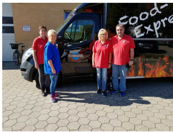
Es war herrlich eingedeckt und die Mitarbeiter des Partyservice Petermann ließen es an nichts fehlen.